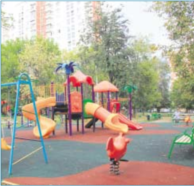
Игровые площадки во дворах на ул. Челябинской, д. 7 (на переднем плане) и д. 11 (вдалеке).

Во дворах Южного Измайлова оборудованы радующие глаз детские и спортивные городки.