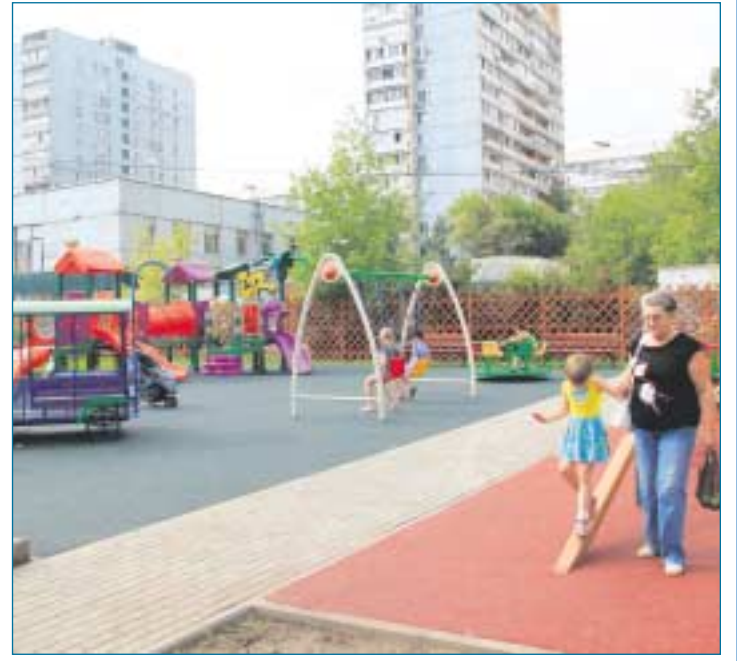
Детский городок у дома 17 по Челябинской улице.