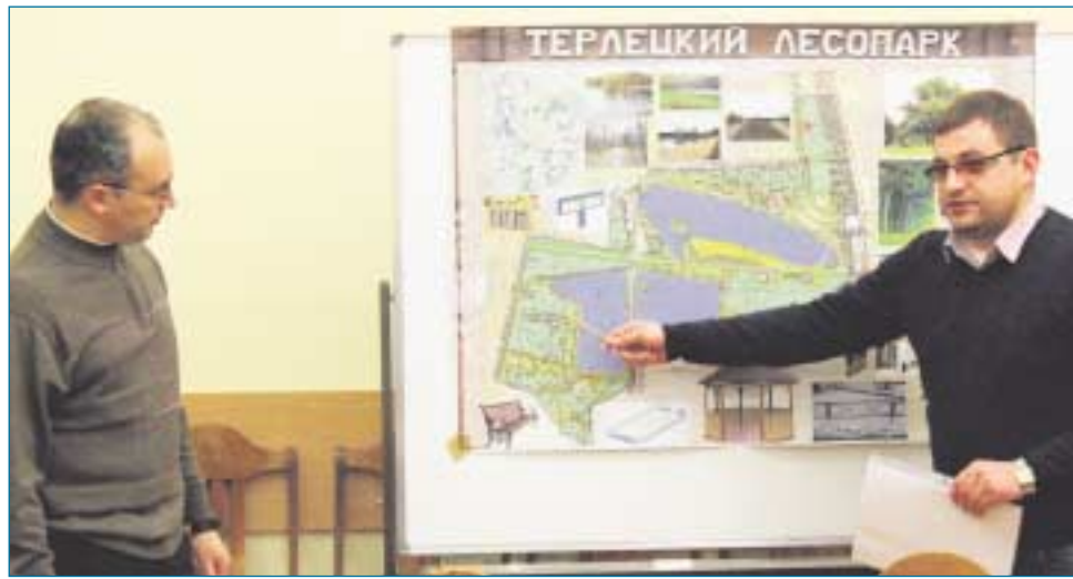
Территория, отведенная для проектирования, составляет 19,76 га и входит в состав Терлецкого лесопарка площадью 141 га.