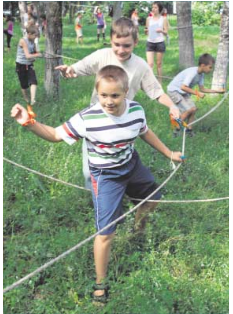
Лето 2011 года. Районный туристический слет.

Серьезные успехи сопутствовали району в спорте. 14 декабря в помещении Паралимпийского комитета на Саянской улице прошел спортивный актив, и были подведены итоги 2011 года – Года спорта и здорового образа жизни. Важнейшее достижение в том, что совместно с МУ ДЦКС «Южное Измайлово» и МУ СПЦ «Мир», РОО социальной реабилитации инвалидов «Навигатор», ГСКЦ «Надежда», общеобра-