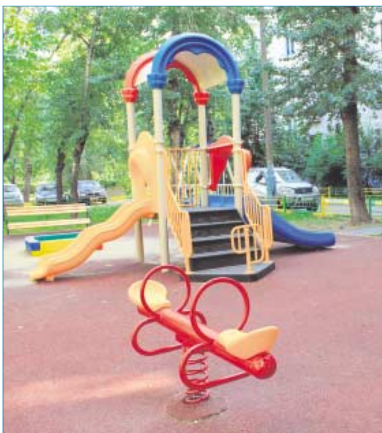
Зеленый пр-т, д.95-97.