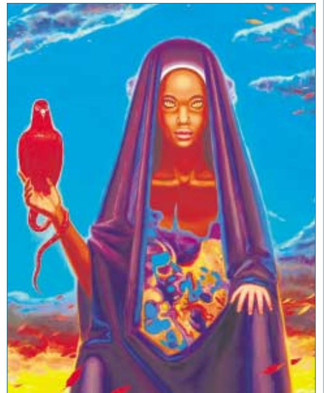
Азриели В.С. Предназначение, 2011, холст, масло.

Сегодня работы Азриели находятся в частных коллекциях в России и за рубежом. Но друзья художника собрали некоторые из них, и картины