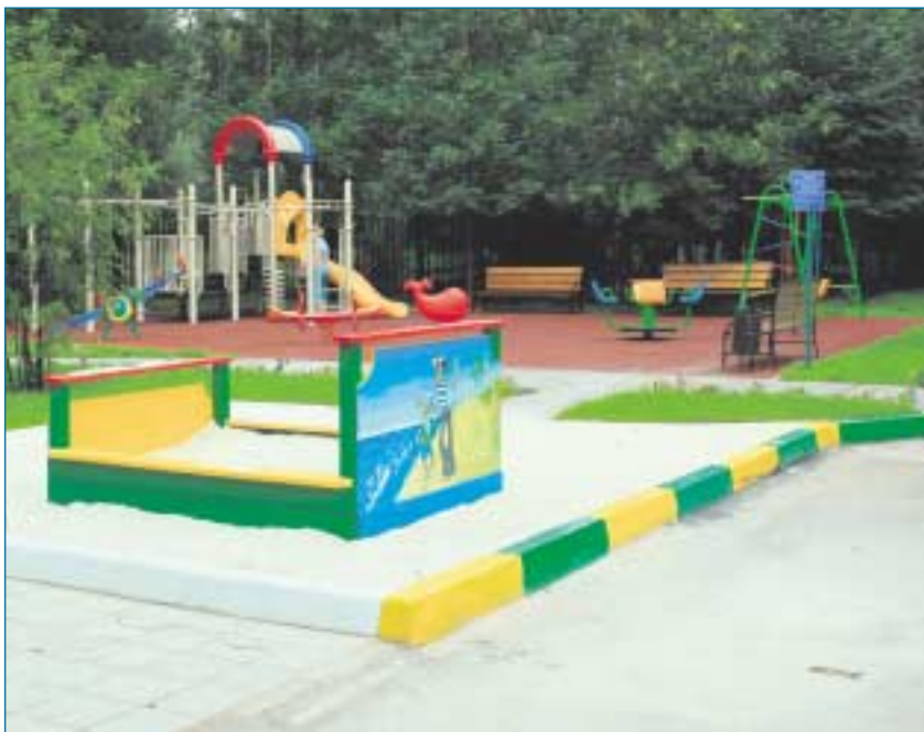
Свободный пр-т, д.11 корп.5.