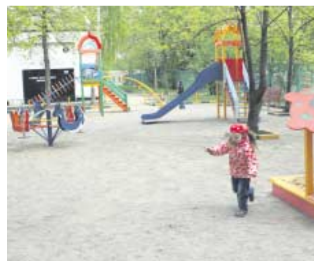
Двор по адресу: Б.Купавенский пр-д, д.4 – благоустроен в этом году.

На стр. 5–8 публикуем информацию об объемах и сроках работ по комплексному благоустройству дворовых территорий и ремонту подъездов в районе Ивановское.