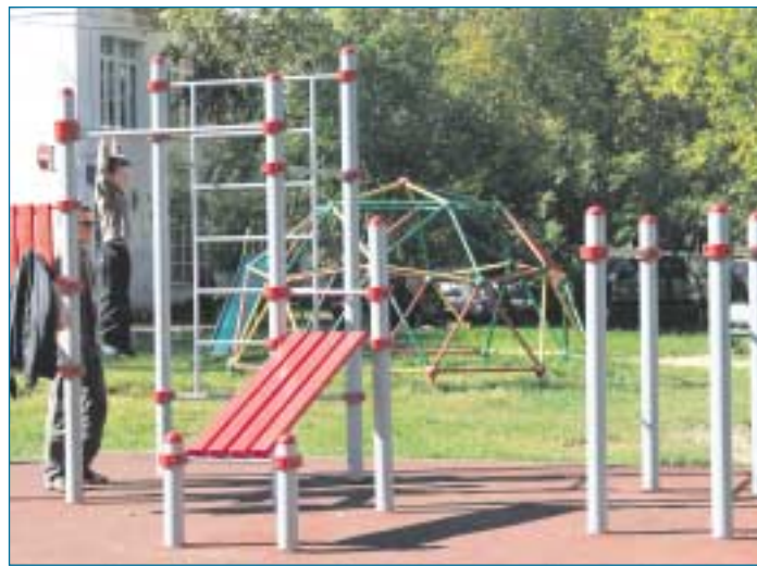
Спортивная площадка и воркаут на ул. Молостовых, д. 12.

– Вокруг нашего дома в последнее время оборудовали сразу три площадки. В основном туда и ходим. Хорошо, когда есть место, где можно погонять мяч с детьми, покидать