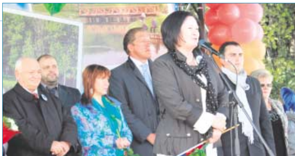
Администрация района Ивановское и почетные гости поздравляют жителей с праздником.

Впечатляющее зрелище представляла собой праздничная колонна: в то время как ее голова уже выходила к месту проведения праздника, последние демонстранты лишь начинали движение вдоль Терлецких прудов.