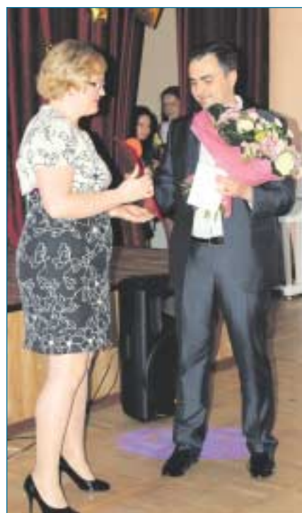
Беседу вел Сергей ОВЧИННИКОВ

Команда школы № 400 заняла первое место на районном этапе конкурса в Ивановском. На окружном этапе младшие заняли второе место, а старшие – первое. И на 36-й Московской городской слет юных инспекторов дорожного движения в лагерь «Патриот» поехали обе команды. Из 35 выступивших там команд наши младшие стали седьмыми, старшие вышли на четвертое место в общем зачете. В следующем году будем бороться за победу в городе Москве.