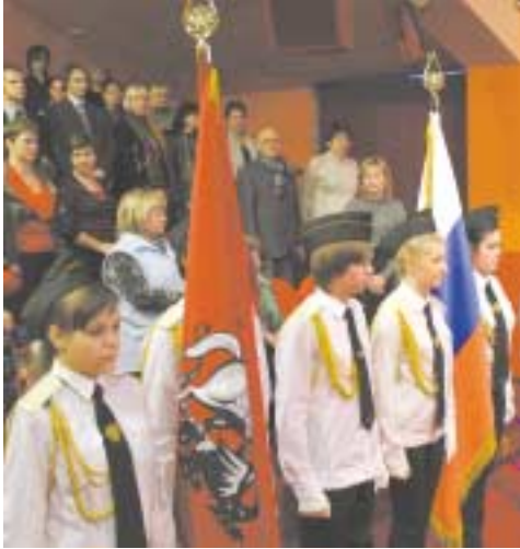
Начало на стр. 1.

Префект высказал пожелание, чтобы такой же заинтересованный контроль исходил от депутатов муниципальных Собраний и неравнодушных жителей, чтобы молодые предприниматели и общественные деятели нашли поле для применения талантов, энергии, средств, включившись в трудовое соревнование по хозяйственному обслуживанию этих площадок и комплексов.