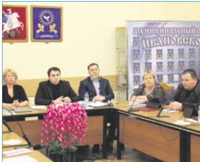
4 марта на очередном заседании Совета депутатов муниципального округа Ивановское прозвучала информация о работе в 2013 году медицинских учреждений, обслуживающих жителей района Ивановское.